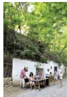
FOTO DOLE: Manfred Horvath FOTO NAHORE: Christof Crenner (návrh) / Tobias Colz (vizualizace)